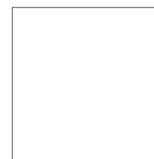
R-099 Blanco-Blanco / White-White RAL 9003